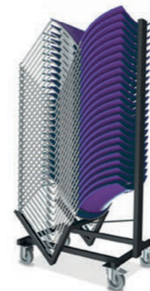
25 x Carver

F Des cafétarias aux salles de réunion, Carver procure à une pièce, un style original et contemporain. Déclinée dans 11 coloris de polypropylène, elle peut éventuellement être dotée d'un rembourrage. Une tablette écrivain et un panier à livres amovibles sont également proposés en option, lors d'une utilisation dans une salle de séminaire. L'assemblage au niveau du sol permet une disposition rapide en rangées. Il est possible d'empiler jusqu'à 25 chaises sur un chariot de transport et de les passer ensuite par une porte standard.