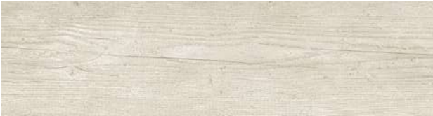
A00407 WHITE WASH