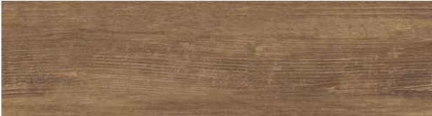
A00414 ANTIQUE MAPLE