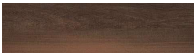
A00201 BLACK WALNUT