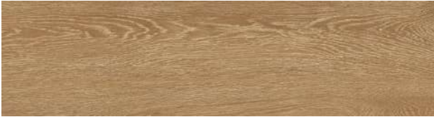
A00415 ANTIQUE OAK