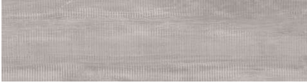
A00424 RUSTIC BIRCH