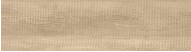
A00420 RUSTIC CASHEW