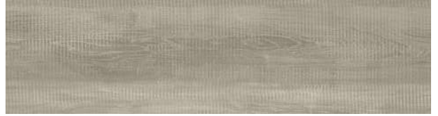
A00423 RUSTIC ASH