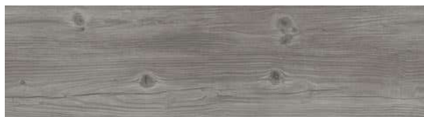
A00206 WINTER GREY