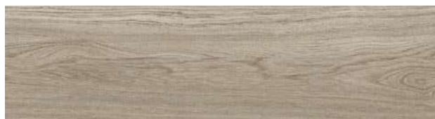
A00207 WASHED WHEAT