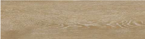
A00406 ANTIQUE LIGHT OAK