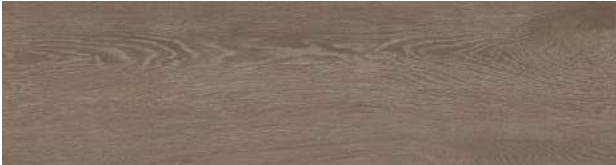
A00416 ANTIQUE DARK OAK