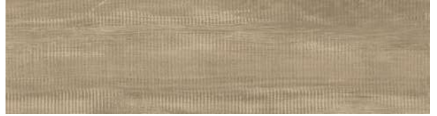
A00421 RUSTIC OAK