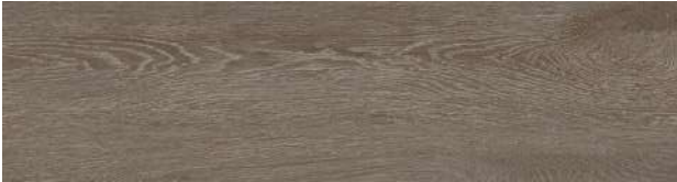
A00418 CHARCOAL DUNE