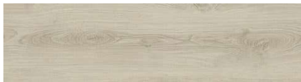
A00208 SAND DUNE