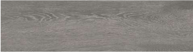
A00417 SILVER DUNE