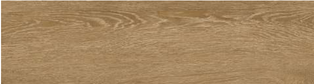
A00419 ANTIQUE ASH OAK