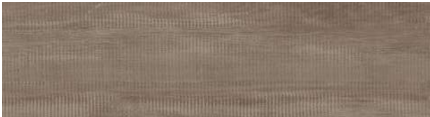
A00422 RUSTIC HICKORY