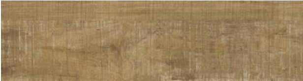
A00403 DISTRESSED HICKORY