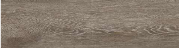
A00405 GREY DUNE