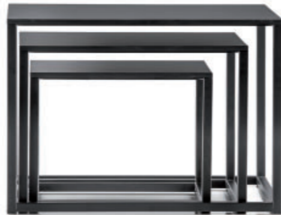
CODE_40X40X30 + CODE_50X50X36 + CODE_59X59X42

The solid laminate top 10mm thickness rests on a square tubular frame 20x20mm in powder coated finish matching the top colour. Dimensions: 400x400x300mm, 500x500x360mm, 600x600x420mm, 600x1200x300mm, 400x400x600mm. Colours : white and black.