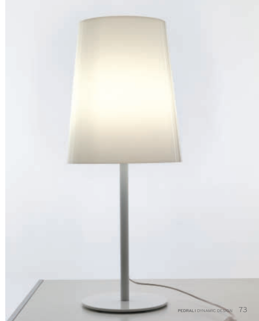
Table lamp with base and structure white or black powder coated and polycarbonate diffuser. Modular, with only two diffusers there is the possibility of four different combinations.

Lampada da tavolo con stelo e base verniciati bianco o nero e diffusore in policarbonato. Modulare, con solo due diffusori si possono avere quattro diverse combinazioni, in numerose varianti di colore.