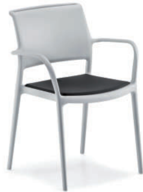
315 + 310.3

Logico table, white or black powder coated frame and matching colour solid compact top. Square or rectangular top available.