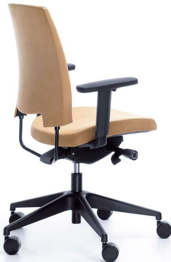
ARCA 21SL BLACK P54PU