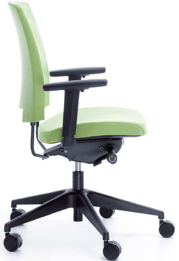
ARCA 21SL BLACK P54PU