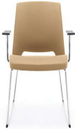
ARCA 21V CHROME PP