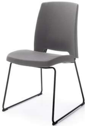
ARCA 21V BLACK