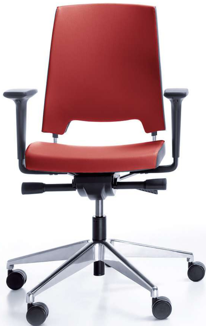
ARCA 21SL CHROME P51PU