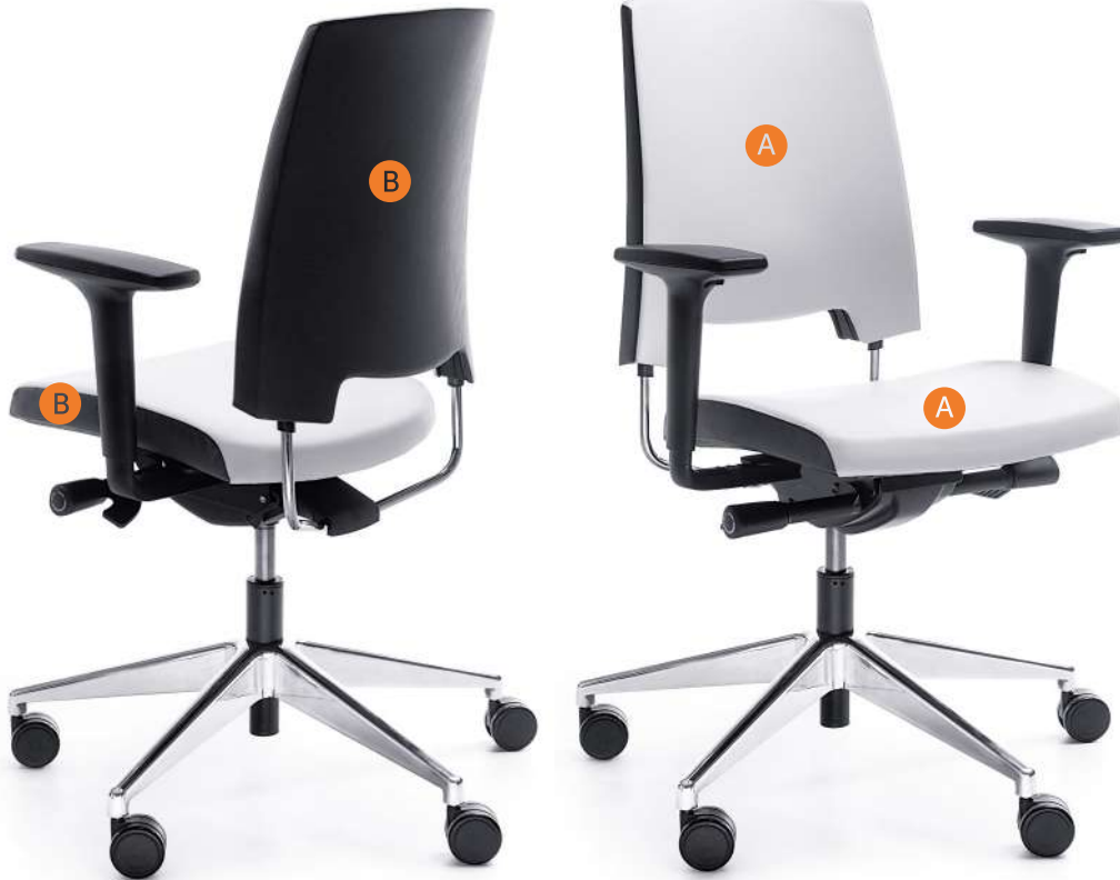
ARCA 21SL CHROME P51PU