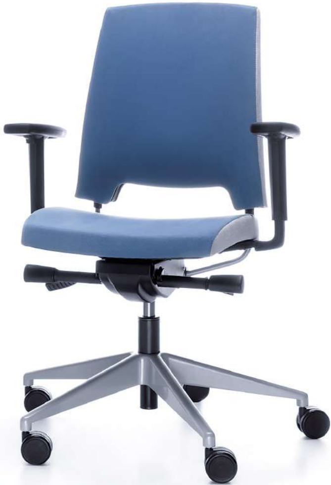
ARCA 21SL METALLIC P54PU