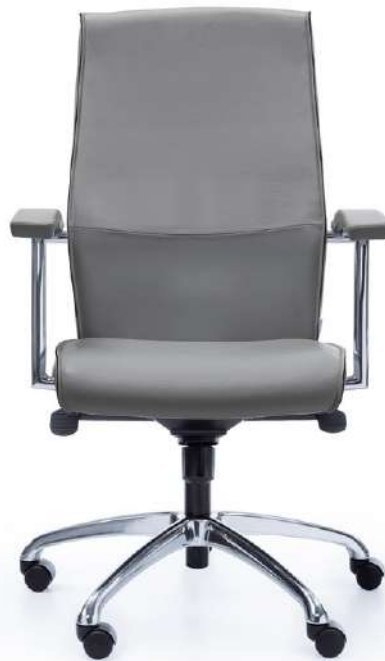
NIKO 31Z CHROME O