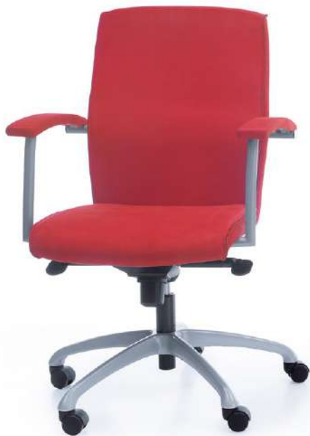
NIKO 41Z METALLIC O