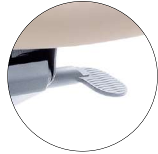
Adjustment of the tilt angle of a shell. Knie - Wippmechanik.