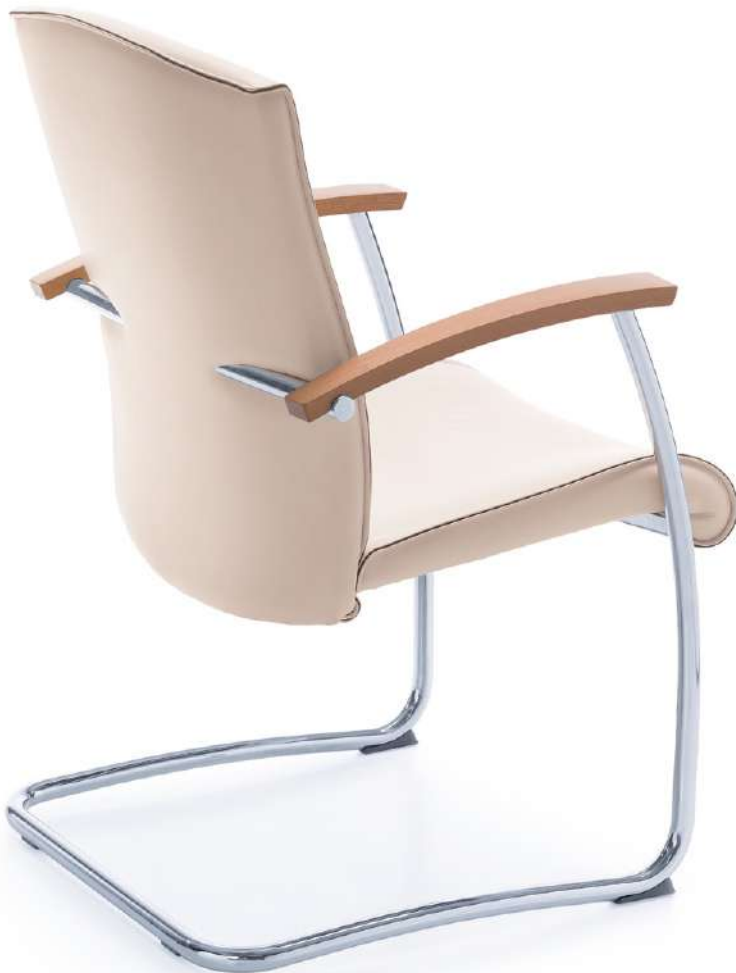
NIKO 21V CHROME H

Conference version with a metal cantilever Konferenzfreischwinger