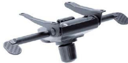
NIKO swivel armchair is equipped with hinged mechanism which enables user to recline the shell with the possibility to adjust the resilience to the weight of the sitting person.

Der NIKO Chefsessel ist mit einer Knie - Wippmechanik ausgestattet, die in zwei Positionen arretierbar ist.