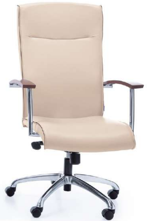
NIKO 11Z CHROME H