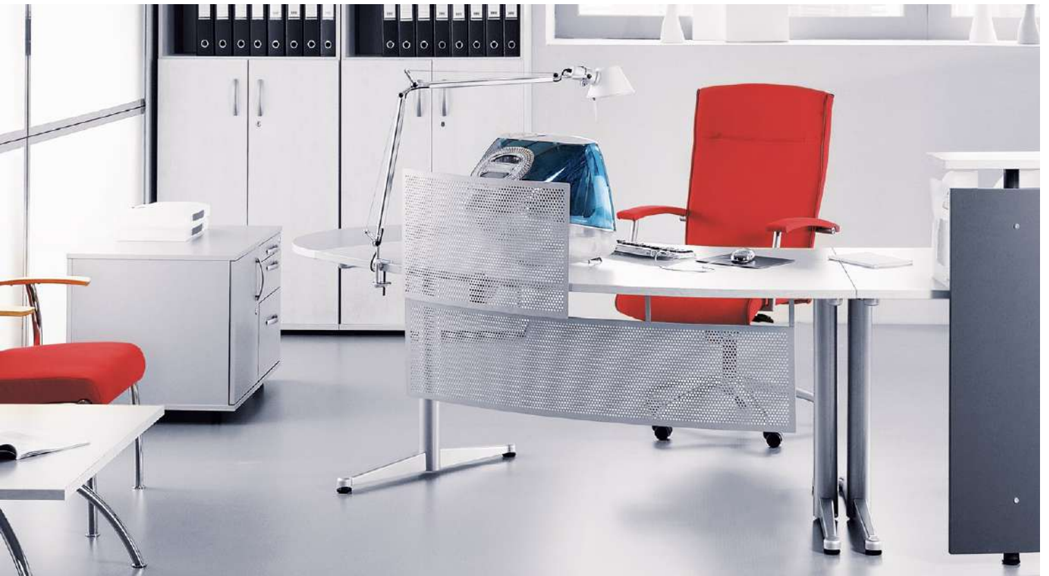
NIKO 11Z METALLIC O