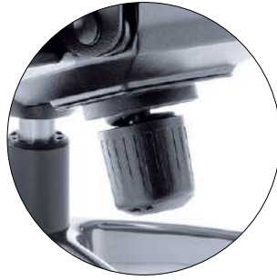
Tension force adjustment (fit to the weight of seating person). Federkrafteinstellung zur individuellen Einstellung des Gegendruckes der Rückenlehne auf das Körpergewicht.