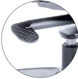
Seat height adjustment. Sitzhöhenverstellung.